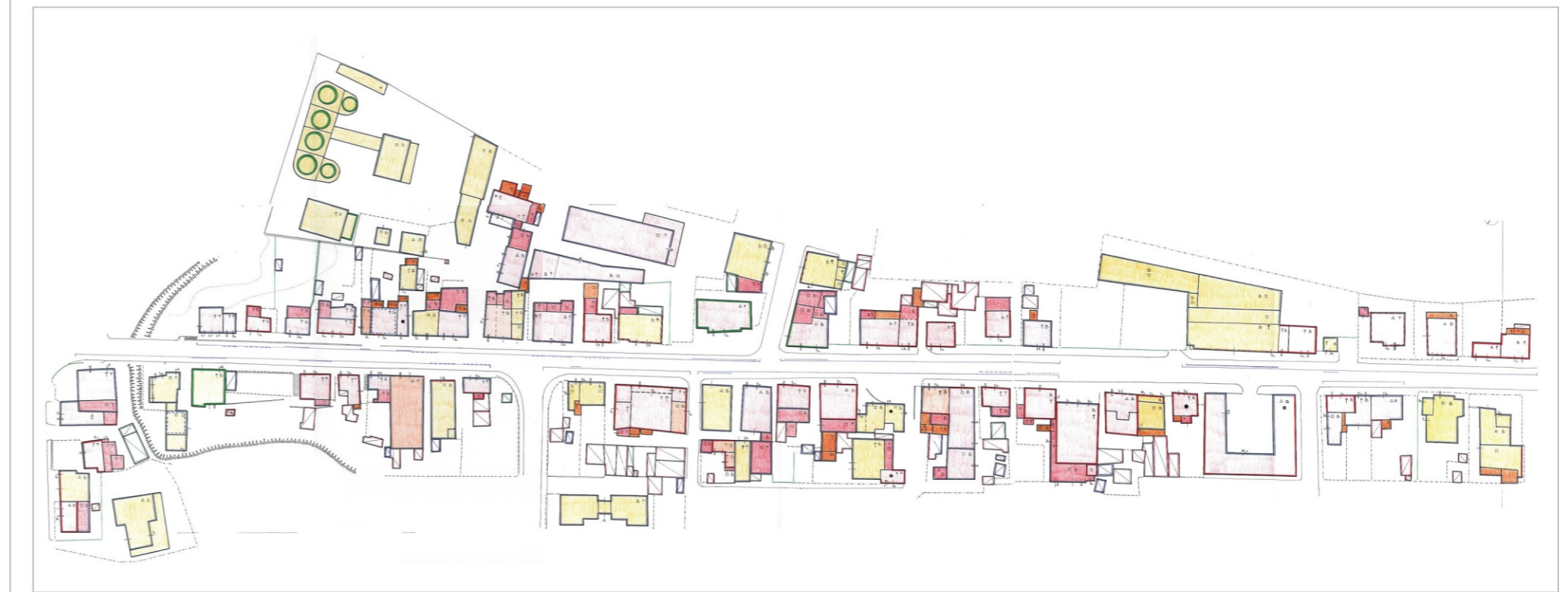
TAV.4 CARATTERI DEGLI SPAZI APERTI (aggiornamento "Atlante Urbano") scala 1:2000